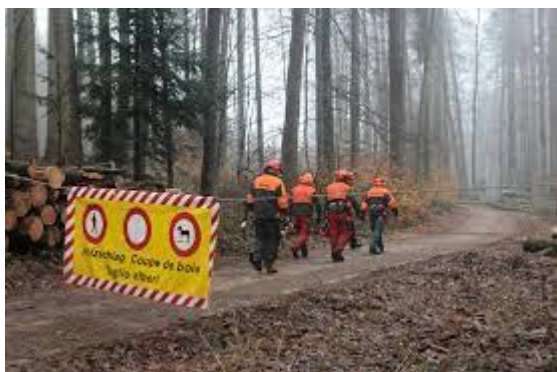
Oben Durchgang verboten: Wo geholt wird, lauern vielerlei Gefahren, die von Laien oft unterschätzt werden.

Die Hauptsaison der Holzerei konzentriert sich auf die kühlere Saison und dauert je nach Höhenlage von Oktober bis März. Zwangsnutzungen nach Stürmen oder bei Borkenkäferbefall sowie Pflege-Eingriffe finden rund ums Jahr statt.