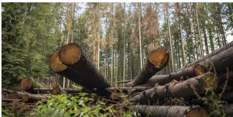
Schlagflächen; reizvoll zum Rumklettern, aber unter Umständen lebensgefährlich.