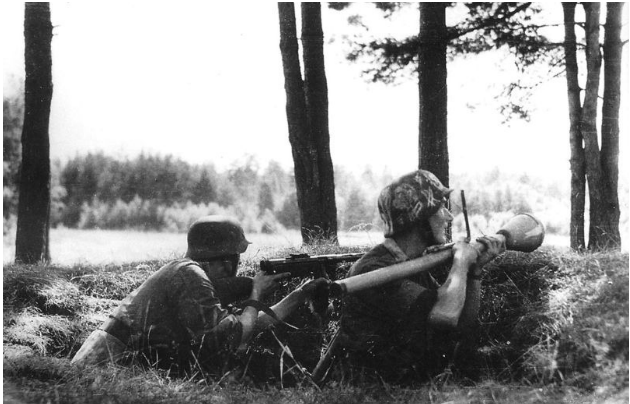
Finnische Infanterie 1944 in der Schlacht von Tali-Ihantala